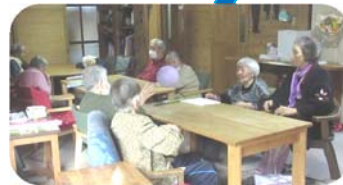
宅老 （団らんのひととき）