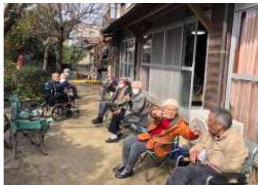
寒い日も皆さん元気です