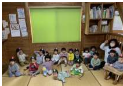
小さな鬼さんたち