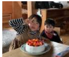
2月お誕生日おめでとう！！