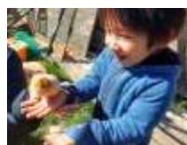
ピヨピヨかわいいね