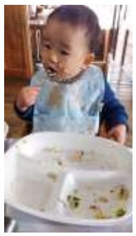
自分でたべるよー