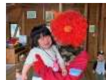
言葉になりません