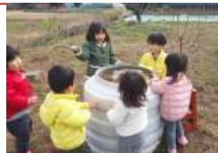
氷ができてるよー