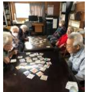
カルタで真剣勝負