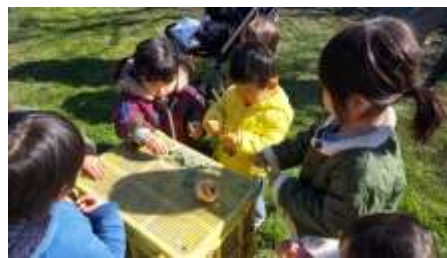
寺松自然農園にヒヨコを見に行きました