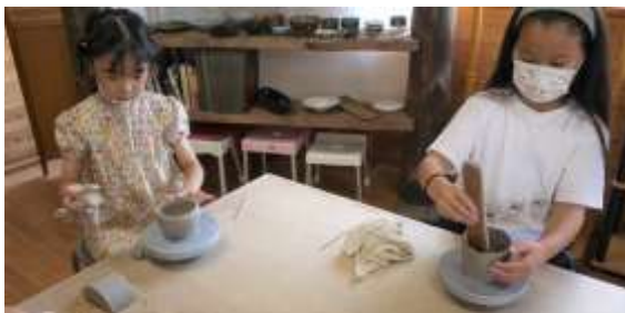
陶芸に真剣に取り組んでいます。