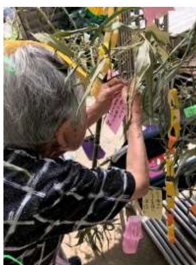
願いが叶いますように。