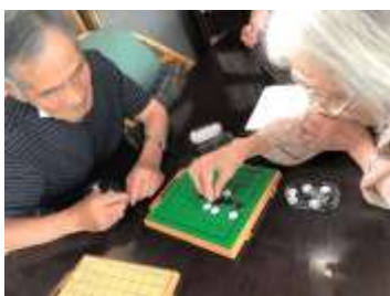
勝つのはどっちでしょう？