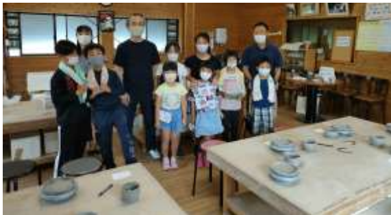
陶芸教室集合写真午前の部

夏休み学童もはじまり賑やかな毎日です。川遊びや庭でのセミとり、そうめん流し等夏にしかできない体験をしています。