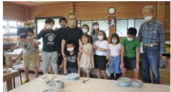
陶芸教室集合写真午後の部