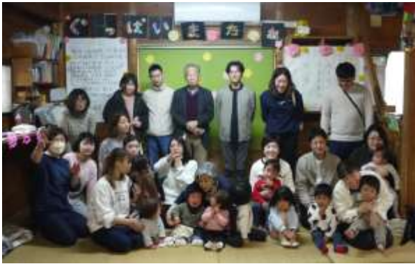
お別れ会の集合写真です。