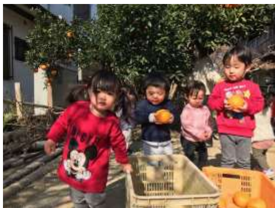
庭でみかん狩りをしました。 たくさんとれました。