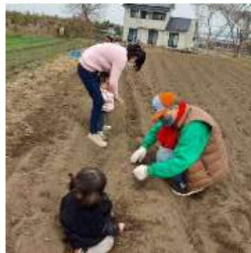
じゃが芋の種うえをしました。