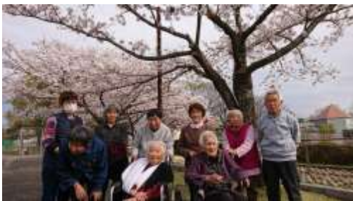
桜の花見に出かけました。