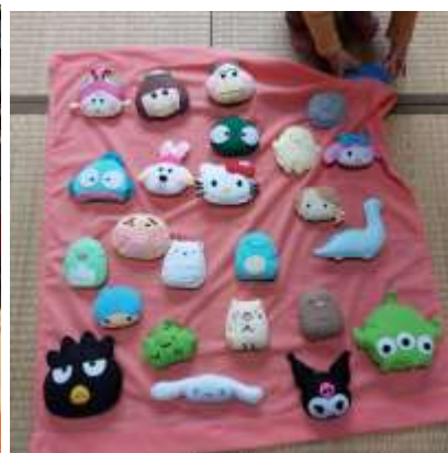
福島高校の生徒さんよりかわいいぬいぐるみ 等を沢山いただきました。