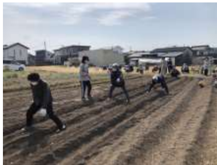
子供たちと一緒に畑にじゃが芋の種をまきました。