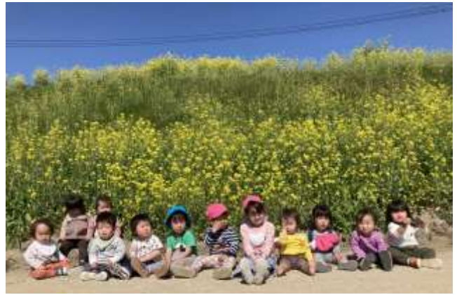
きもちのいい天気でした。